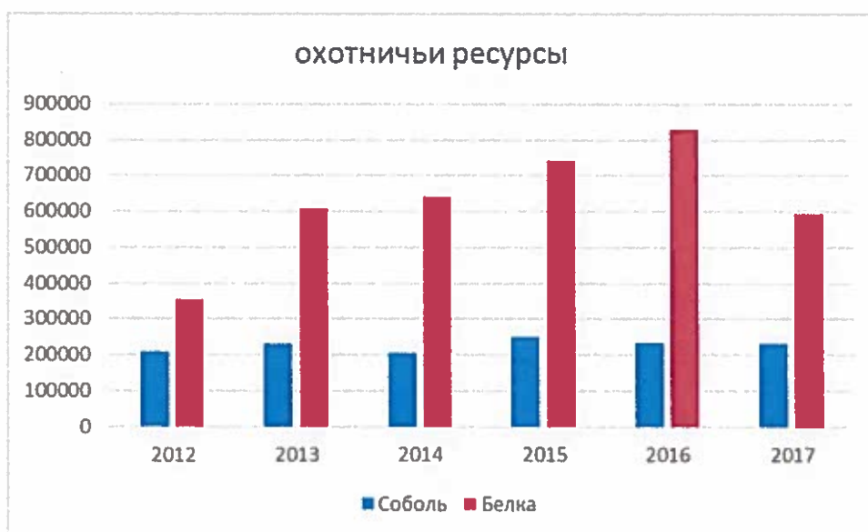
Рис.2. Динамика численности соболя и белки 2012-2017 гг.

Из анализа динамики можно сделать вывод, что критичного уменьшения численности зонтичных видов не наблюдается, изменения не выходят за рамки среднестатистических.