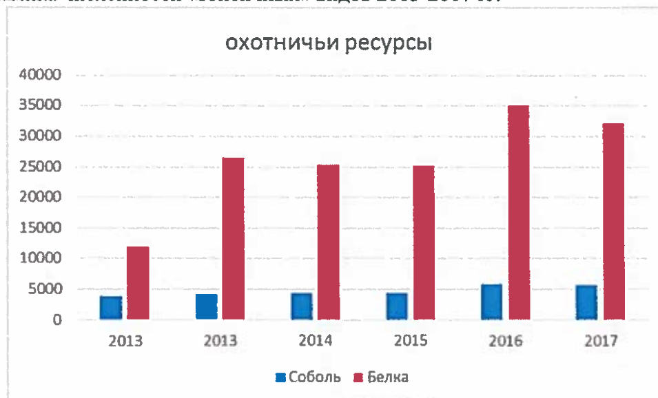
Рис.2. Динамика численности соболя и белки 2013-2017 гг.

Из анализа динамики можно сделать вывод, что критичного уменьшения численности зонтичных видов не наблюдается, изменения не выходят за рамки среднестатистических.