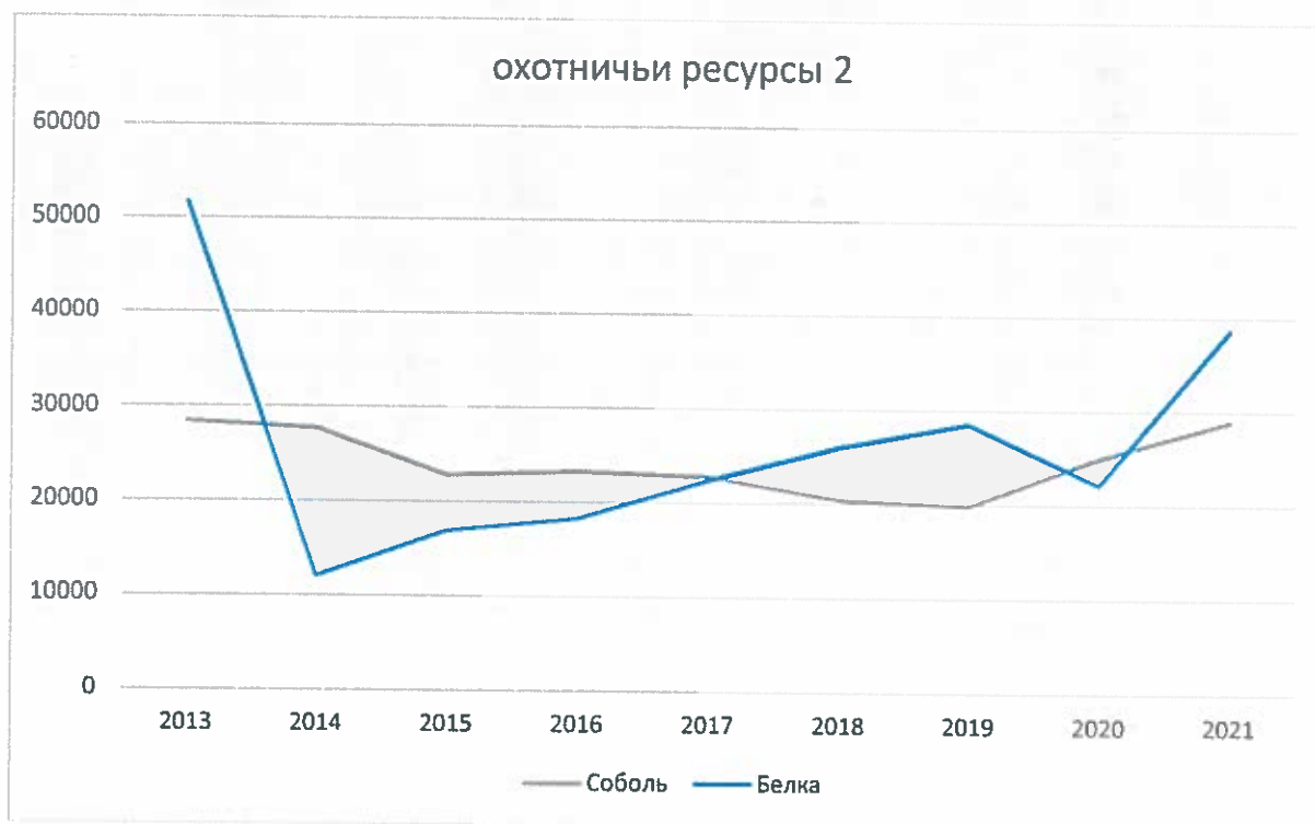
Рис.2. Динамика численности соболя и белки 2013-2021 гг.

Из анализа динамики можно сделать вывод, что критичного уменьшения численности зонтичных видов не наблюдается, изменения не выходят за рамки среднестатистических.