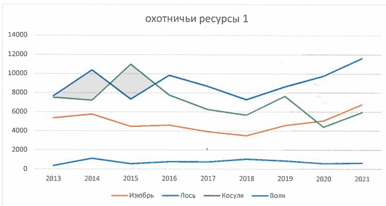
Рис.1. Динамика численности «зонтичных» видов 2013-2021 гг.