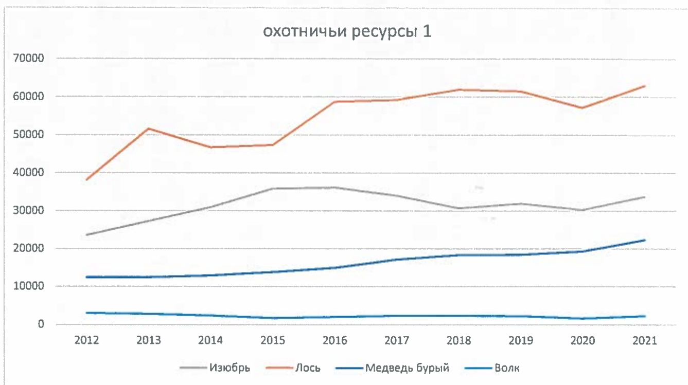
Рис.1. Динамика численности «зонтичных» видов 2012-2021 гг.